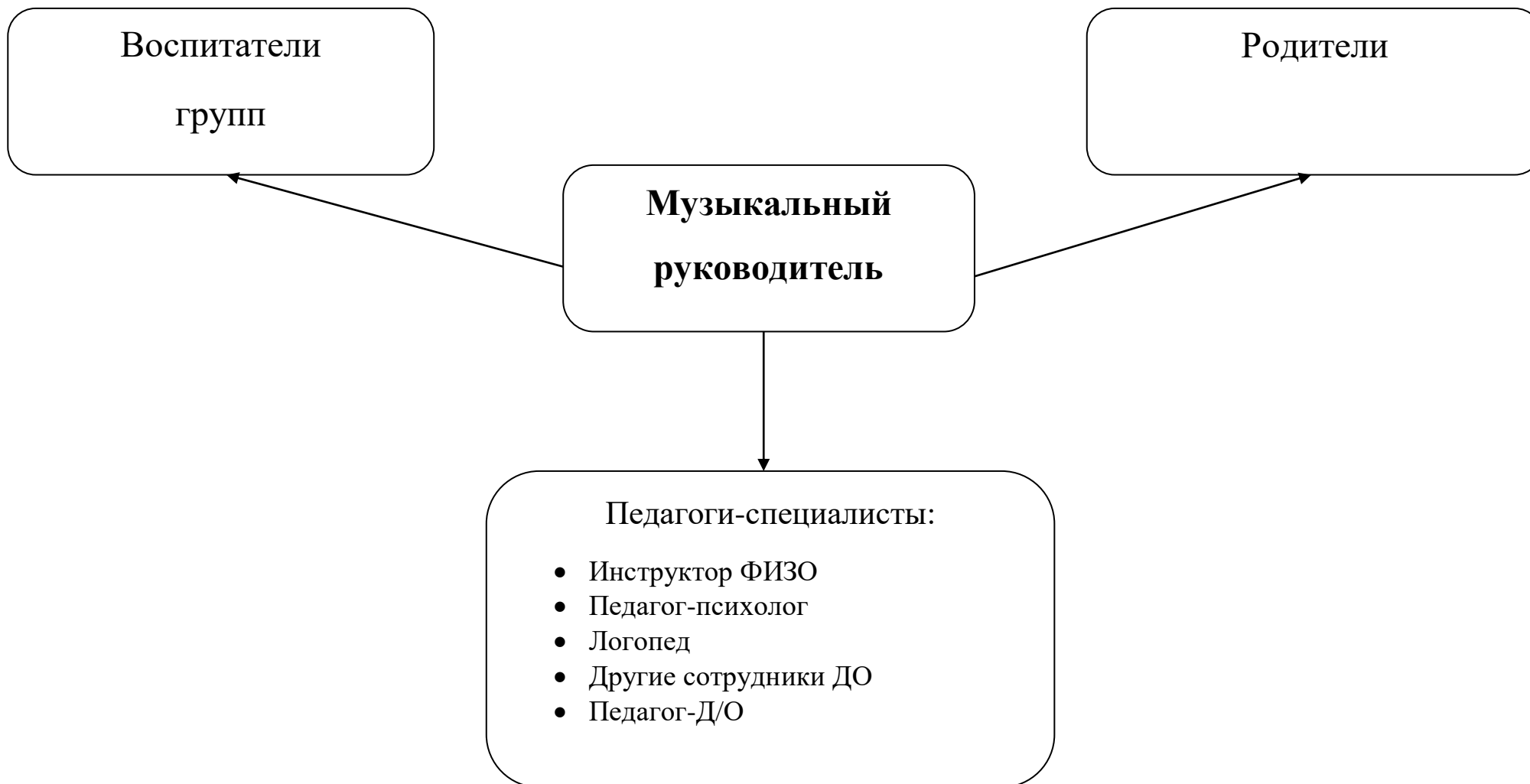
Схема организации работы по взаимодействию с другими участниками образовательного процесса